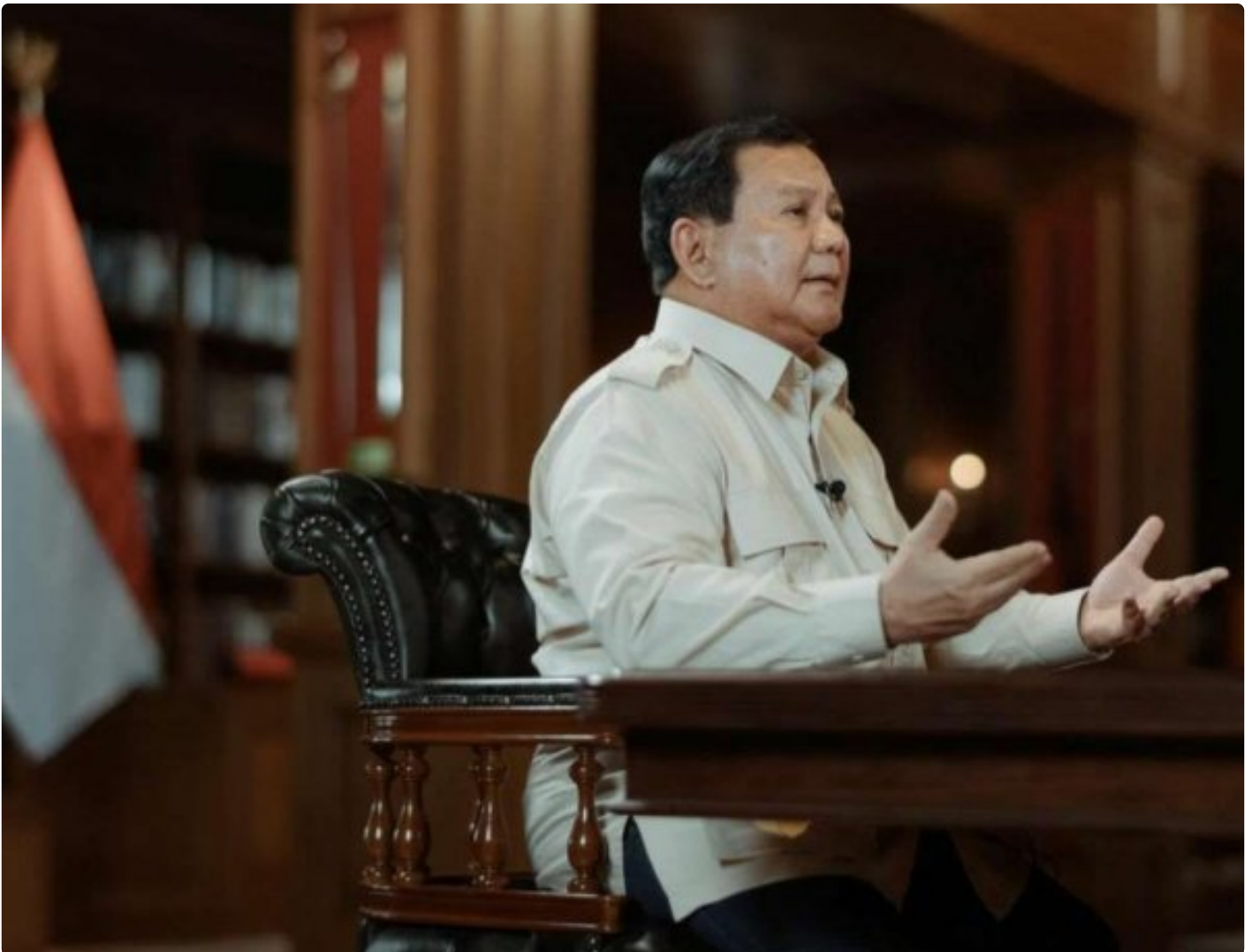
Prabowo Subianto Presiden RI 2024-2029

PENDIDIKAN - Indonesia dikenal sebagai negara yang kaya akan sumber daya alam. Dari hasil tambang yang berlimpah, laut yang luas dengan kekayaan hayati yang melimpah, hutan yang menjadi paru-paru dunia, hingga sumber daya energi